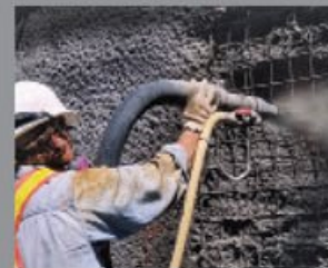
Tokom nanošenja betona prskanjem