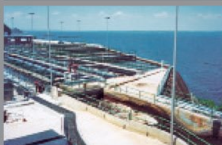
Ponta Do Ismael Water Treatment Plant, Brazil