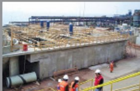
Reverse Osmosis Desalination Plant, Čile