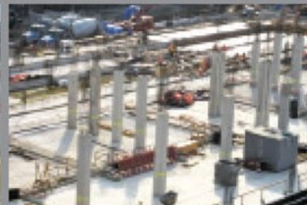
Croton UV Water Treatment Plant, USA