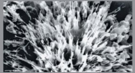
ZAVRŠEN PROCES KRISTALIZACIJE