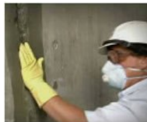
Zatvaranje rupa Patch'n Plug