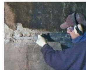
Oporavak betona Patch'n Plug i Megamix