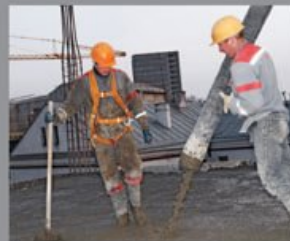
U toku montiranja