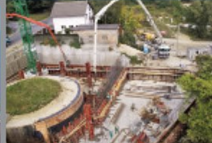
Koliba Water Reservoir, Bratislava

Pronađite Xypex distributera u Vašoj državi.