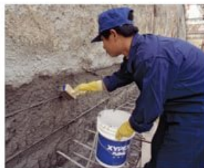
Premazivanje Koncentrat i Modified

Xypex premazi i proizvodi za reparaciju omogućuju vlasnicima, inženjerima i investitorima da ekonomično i pouzdano poprave oštećene strukture za preradu vode. Xypex Koncentrat i Modified se primenjuju u vidu premaza na površini betona. Za razliku od drugih materijala za koje je potrebna suva podloga, Xypex proizvodi zahtevaju vlažnu površinu – uslovi koji su tipični za strukture za preradu vode. Ova sredina je odgovarajuća za proces Xypex Kristalizacije.